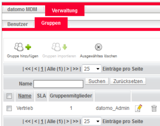
Abb.8 Gruppen anlegen